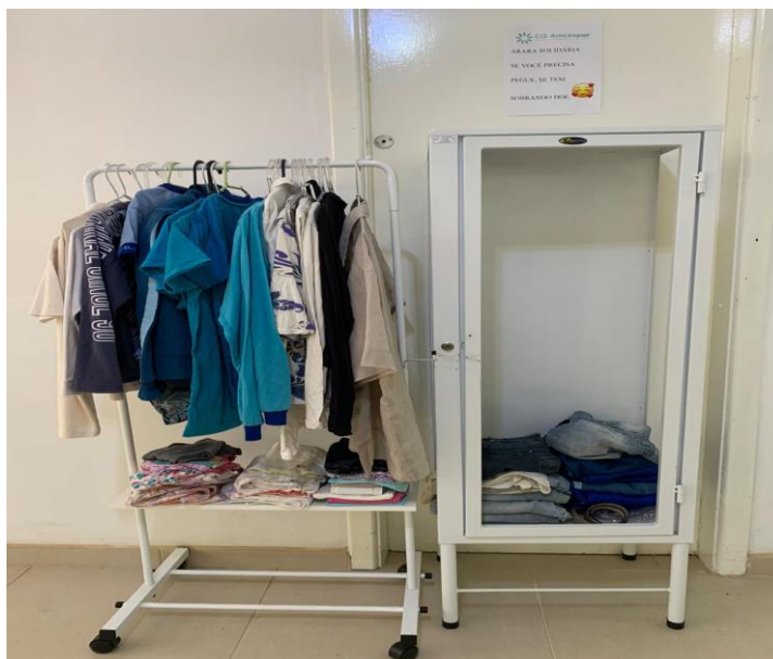
Imagem da arara solidária do CIS Amcespar.

A arara fica em local de fácil acesso a todos e com uma orientação com o texto: “SE VOCÊ PRECISA PEGUE, SE TEM SOBRANDO DOE” e ao chegar para realizar uma consulta ou exame, o cidadão pode agasalhar-se ou deixar peças de roupas e/ou calçados para quem precisar.