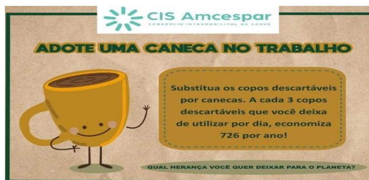
Folder colocado na copa dos funcionários do CIS