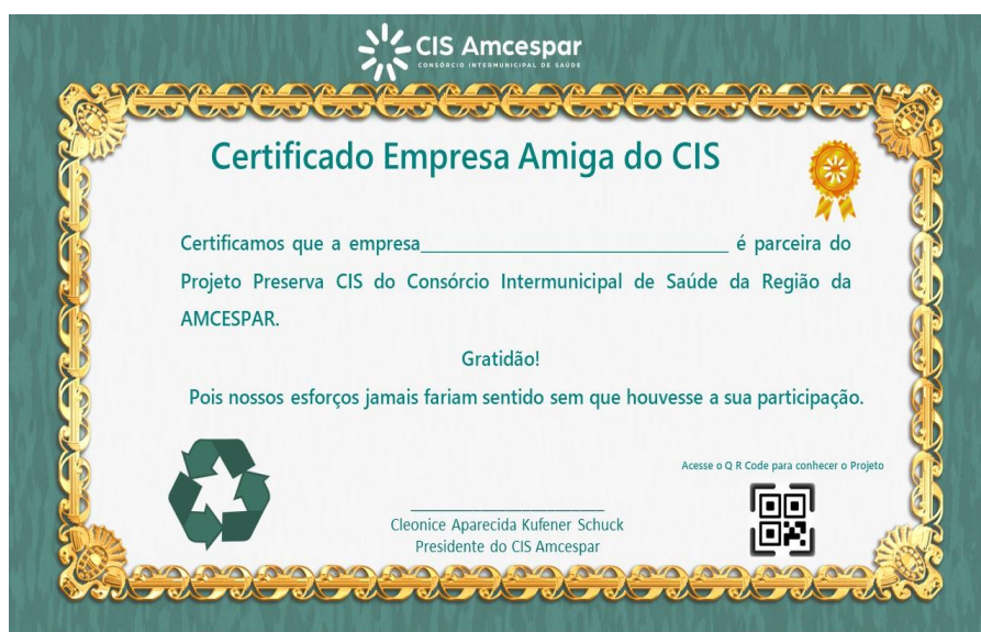
Certificado Empresa Amiga do CIS

Como forma de incentivar a parceria público privada, o Consórcio CIS Amcespar criou um Certificado denominado EMPRESA AMIGA DO CIS, o qual dispõe também de um QR code para acessar o conteúdo do projeto PRESERVA CIS. Este certificado é entregue para as empresas que de alguma forma contribuem para o desenvolvimento do projeto. Esta ação busca fortalecer estes vínculos e expandir os objetivos do projeto para as empresas privadas.