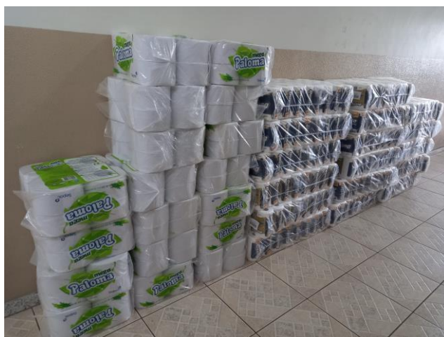
Papeis obtidos em umas das trocas realizadas

Esta ação consiste na conscientização da equipe técnica e administrativa do Consórcio sobre a utilização adequada de papeis, realizando somente impressões extremamente necessárias gerando o mínimo possível de gastos com a compras papéis, impressões e manutenções de impressoras. Os papéis dos arquivos ativos e inativos após o período legal de guarda são armazenados em local específico e quando reunida a quantidade mínima de mil Kg, estes são levados até a empresa SEPAC Softys – localizada no Município de Mallet -Pr, que fabrica papéis higiênicos, toalhas de papel, guardanapos e fraldas descartáveis. O quantitativo de papeis levados pelo Consorcio são trocados por papel higiênico e papel toalha. Esta ação traz resultados na economia de compras destes itens, no transbordo de papel reciclável, na conscientização da equipe e na preservação da matéria prima, ressaltando o compromisso, como Consórcio de Saúde, em estar atento ao princípio da economicidade.